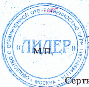
Схема сертификации: 1с (ГОСТ Р 53603-2009 «Оценка соответствия. Схемы сертификации продукции в Российской Федерации»)